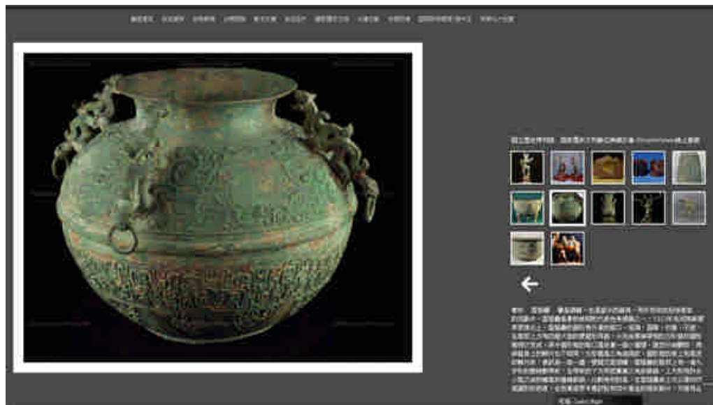
圖 4：動態大圖展示技術