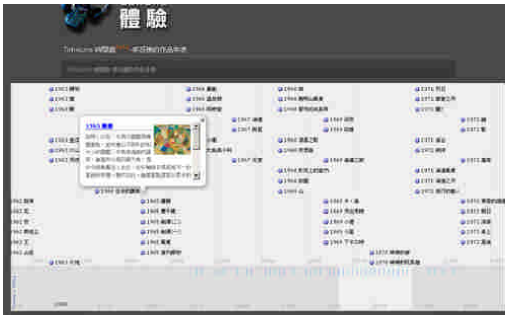
圖 3：時間軸典藏展示技術